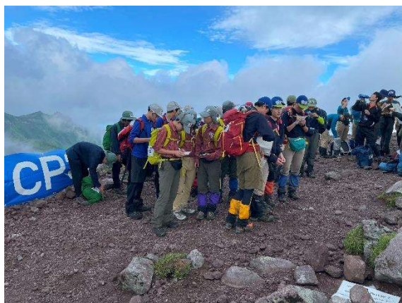
・8月9日 黒岳～北鎮岳 黒岳 CP0