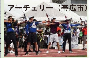
アーチェリー（帯広市）

＜このエリアで行われる他の競技＞ 帯広市 サッカー女子、剣道 釧路市・釧路町 バレーボール女子