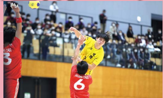
ハンドボール（函館市）