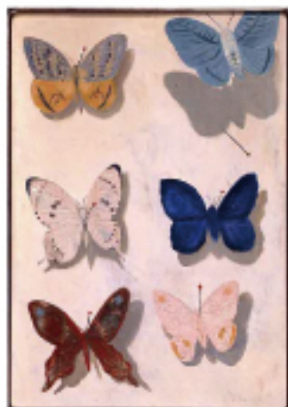
三岸好太郎 <飛び蝶> (mima)

配信動画数は今や30を超えており、今後も新たな展覧会を紹介する動画を配信していきますので、ご注目ください!