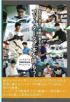
パンフレット 「ファイターズと本を読もう！」