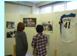
読書応援企画展の様子 檜山管内今金町