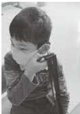
自立活動(環境の把握) ～補聴器とマイクの同期～ (函館豊学校)

特に、自立を目指し、障がいによる学習上又は生活上の困難を主体的に改善・克服し、調和のとれた心身の発達の基盤を培う 自立活動の指導 は、特色ある教育活動の一つです。