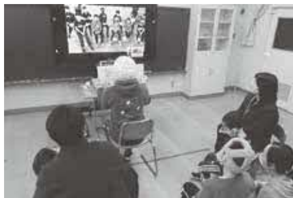
交流及び共同学習 ～小学校に向けた自校の学習の発表～ (帯広盲学校)

さらに、特別支援学校や特別支援学級では、幼児児童生徒の経験を拡充し、積極的な態度を養い、社会性や豊かな人間性を育むために、地域の人々との交流や、小・中学校等の児童生徒との 交流及び共同学習 を進めており、幼児児童生徒の思いやりの気持ちを育んだり、障がいのある幼児児童生徒に対する理解を深めたりする機会となっています。