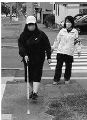
自立活動 ～歩行指導～ (札幌視覚支援学校)

特に、自立を目指し、障がいによる学習上又は生活上の困難を主体的に改善・克服し、調和のとれた心身の発達の基盤を培う 自立活動の指導 は、特色ある教育活動の一つです。