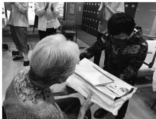
交流及び共同学習 ～高齢者施設への壁面飾りの贈呈～ (室蘭養護学校)

さらに、特別支援学校や特別支援学級では、幼児児童生徒の経験を拡充し、積極的な態度を養い、社会性や豊かな人間性を育むために、地域の人々との交流や、小・中学校等の児童生徒との 交流及び共同学習 を進めており、幼児児童生徒の思いやりの気持ちを育んだり、障がいのある幼児児童生徒に対する理解を深めたりする機会となっています。