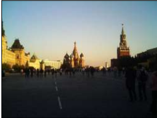
[赤の広場と聖ワシーリー寺院]